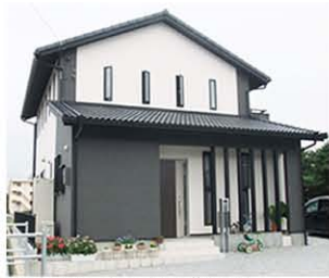
2010年の5月に建てられた新築のお家。黒と白のモノトーンがモダンで素敵です。