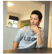
ウッドデッキについて真剣に語るN様

ただ、砂がよく飛んでくる場所なので、布でちょっと拭いて掃除しています。すぐに綺麗になるので、拭いた後は裸足でも外に出て行けますね。