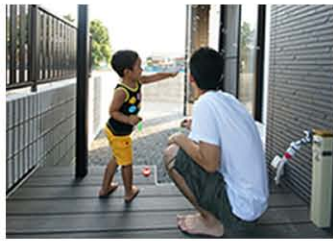
裸足でも安全だから、お子様にも安心です。